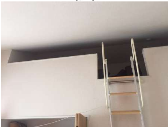
【寝室】ロフト付きです