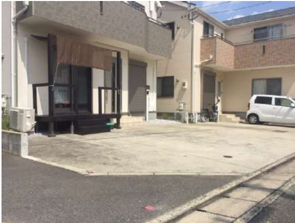
【外観写真】駐車スペースです