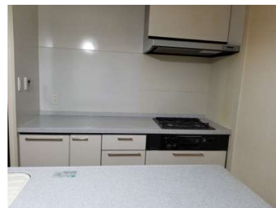
【キッチン】キッチン