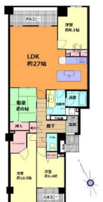
【間取り図】間取り図