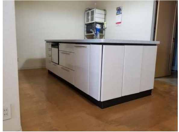
【キッチン】アイランドキッチン