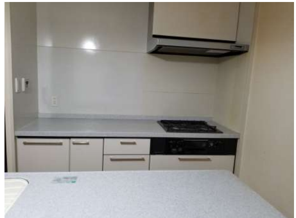
【キッチン】キッチン