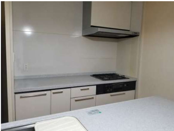
【キッチン】キッチン