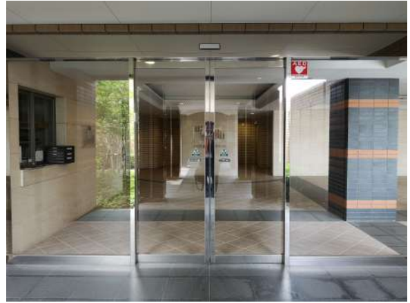
【玄関】エントランス