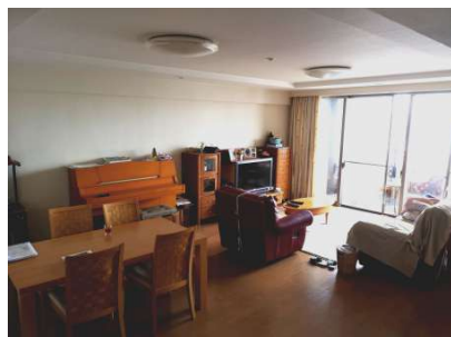
【居間・リビング】リビング