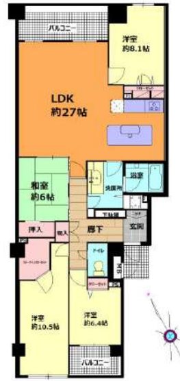
【間取り図】間取り図