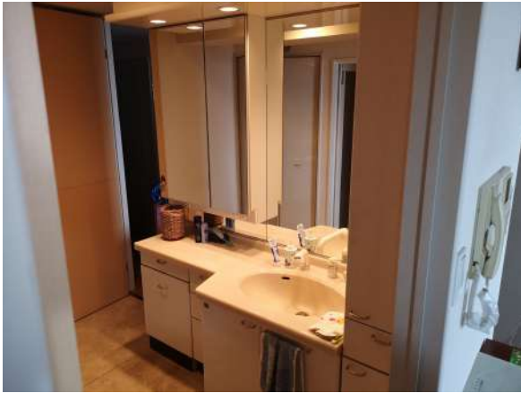
【洗面化粧台】洗面所