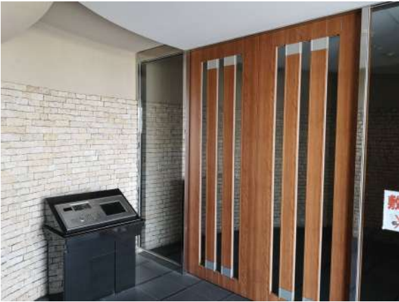
【玄関】エントランス(外)