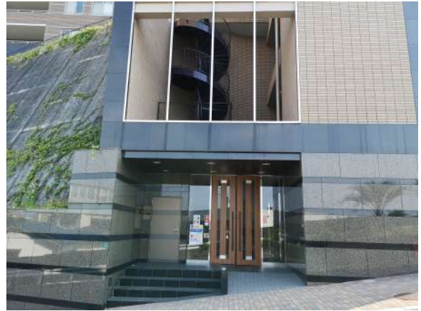
【玄関】エントランス(外観)