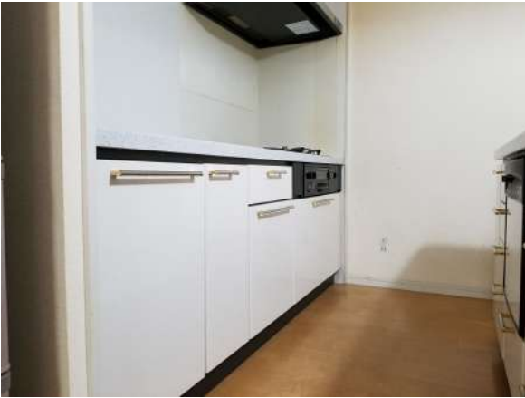
【キッチン】キッチン