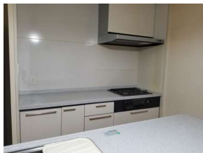
【キッチン】キッチン