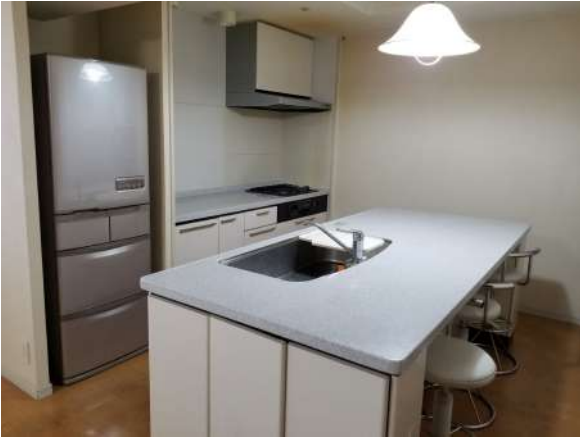
【キッチン】キッチン