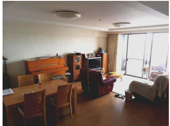
【居間・リビング】リビング