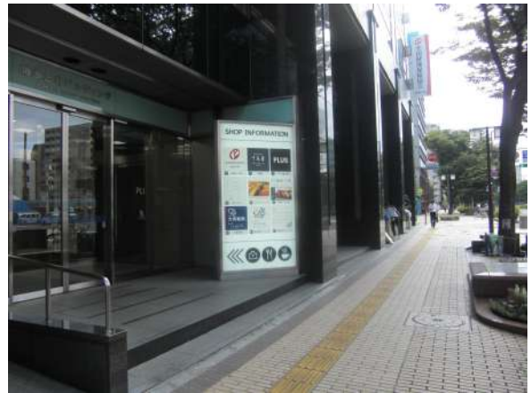
博多三井ビルディングを通り過ぎ、すぐ左へ