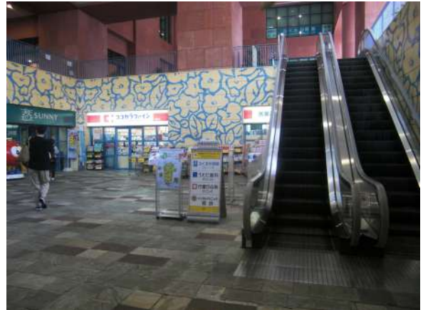
エスカレーターを上り、地上へ