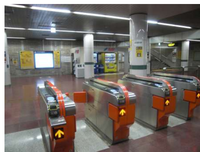
【その他】地下鉄呉服町駅から該当地への行き方をご案内します★