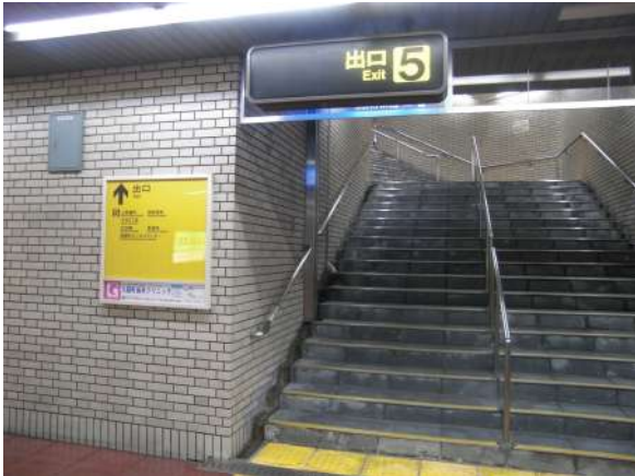
『出口5』より地上に出ます