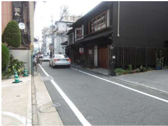
西門通りへ入ります