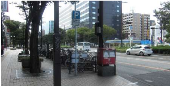
地上に出て左へ曲がります