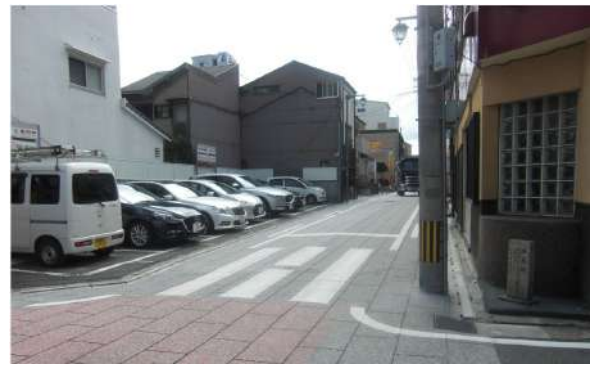
最初の十字路を右へ曲がります