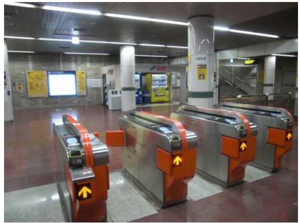
【その他】地下鉄呉服町駅から該当地への行き方をご案内します★