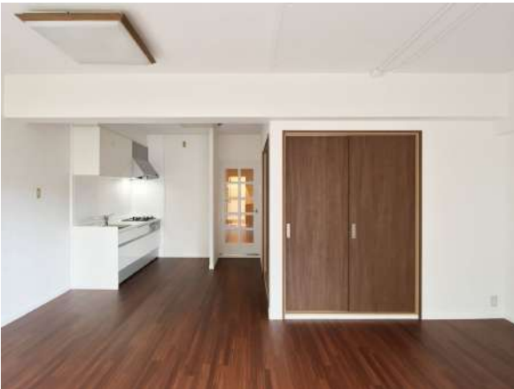
【ダイニングキッチン】