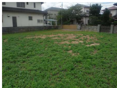
【現況写真】北東側から