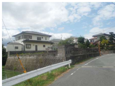
【前面道路含む現地写真】北側前面道路含む土地外観