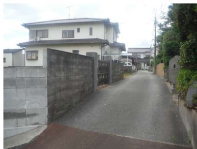
【前面道路含む現地写真】北側前面道路含む土地外観