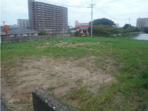
【現況写真】南西側から