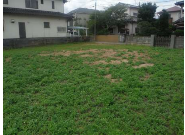
【現況写真】北東側から