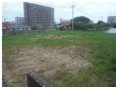
【現況写真】南西側から