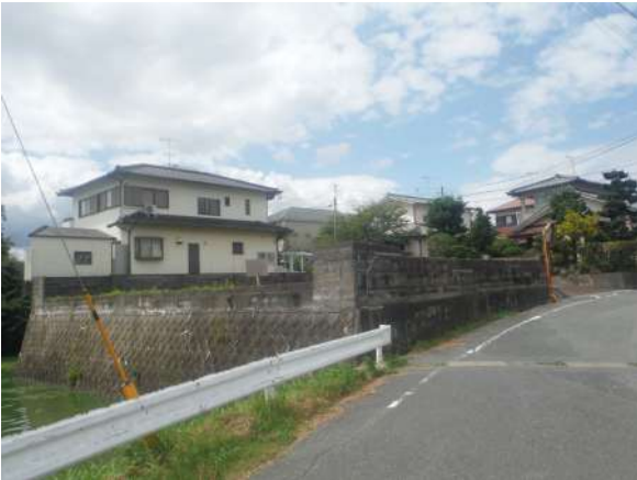
【前面道路含む現地写真】北側前面道路含む土地外観