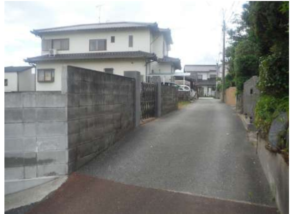
【前面道路含む現地写真】北側前面道路含む土地外観