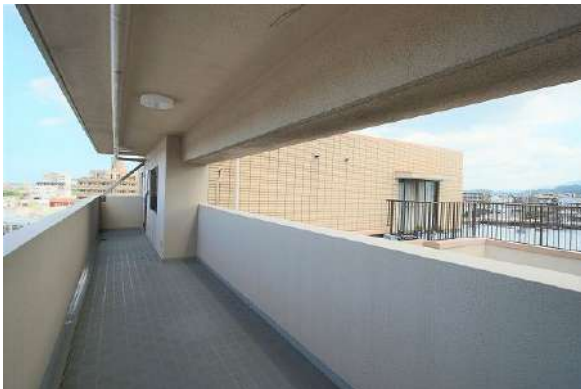
【その他共用部】エレベーターからお部屋までの廊下です。写真奥が玄関です。