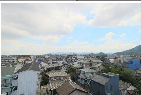
【眺望】お部屋の前は戸建てエリアなので、日当り通風ともに良好です♪