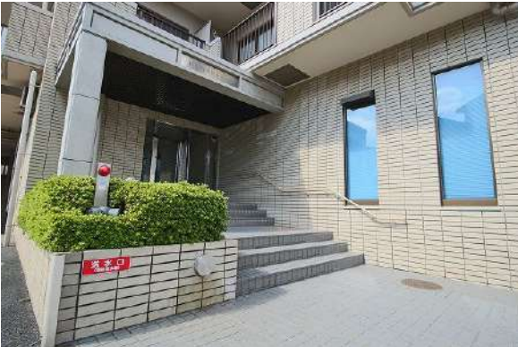
【エントランスホール】共用部分は緑の手入れや清掃が行き届いています