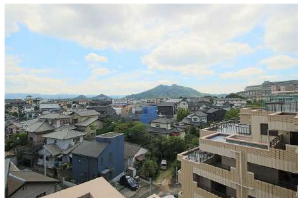
【眺望】遠くに山を望むバルコニーからの眺望です♪