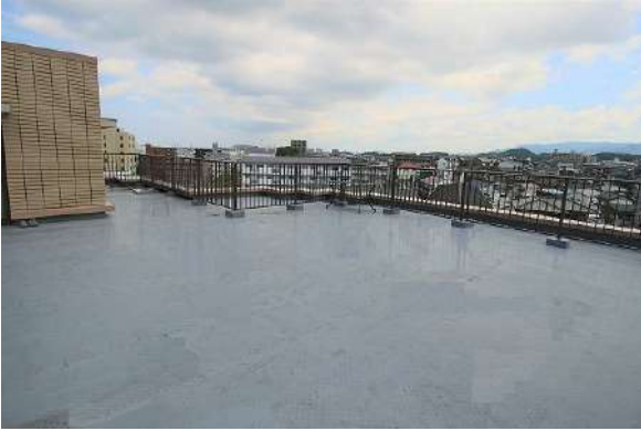
【バルコニー】独立した住戸なので4方向からの採光と通風を確保できます!