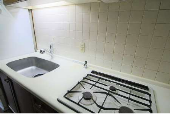
【キッチン】キレイに使用されている水回りです