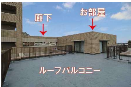
【その他】エレベーターから玄関までの廊下はこちらのお部屋だけの通路です