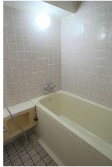
【浴室】ゆったりとしたバスタブです