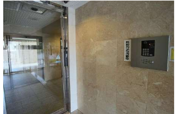
オートロック付きのマンション。お部屋側はモニタホンです。