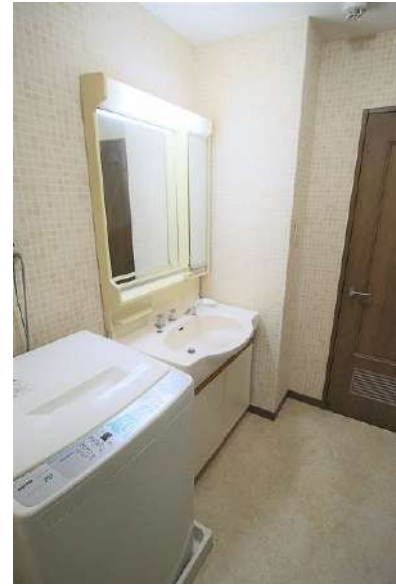
【ランドリースペース】奥行のある洗面室です♪