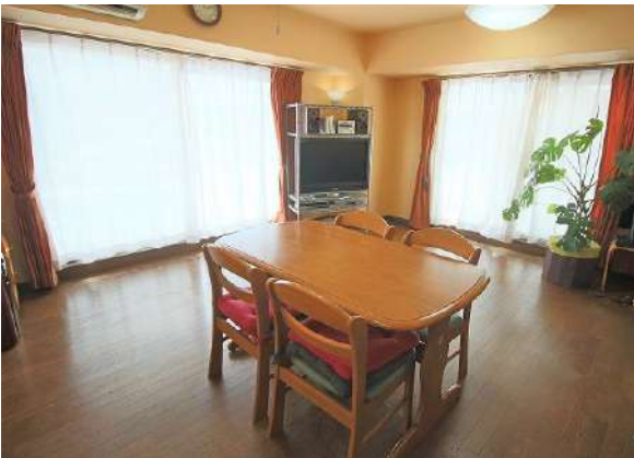
【居間・リビング】開放的な4面採光の間取りです♪

【バルコニー】73㎡超のビッグなルーフバルコニーです(使用料金1200円) 【眺望】お部屋の前は戸建てエリアなので、日当たり通風ともに良好です♪