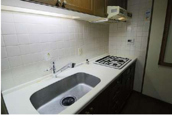
【キッチン】独立タイプのキッチンです♪