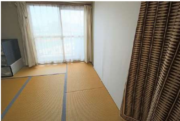
【和室】北側バルコニーに面した和室。曇の日焼けが防止できそうですね。