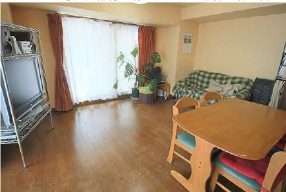
ソファやダイニングテーブルを設置しても余裕があるLDです。