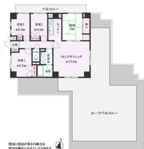
【間取り図】専有面積82.04㎡、ルーフバルコニー面積73.69㎡