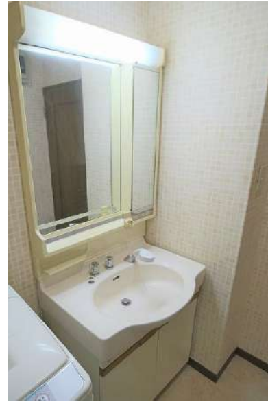
【洗面化粧台】明るい洗面化粧台です♪