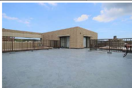
【バルコニー】73㎡超のビッグなルーフバルコニーです(使用料金1200円)