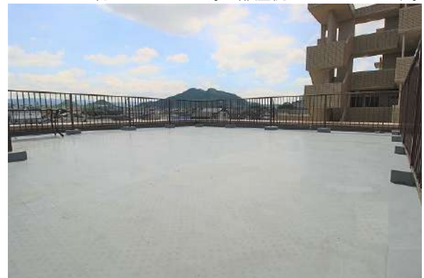
【バルコニー】別方向から撮影したバルコニーです