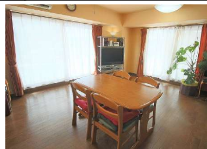
【居間・リビング】開放的な4面採光の間取りです♪