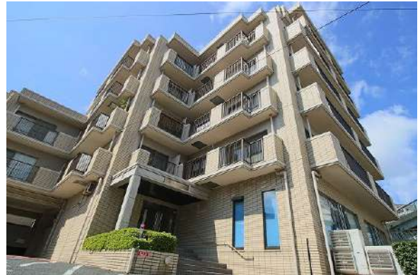
【外観写真】鹿児島本線「福工大前駅」から徒歩約2分の便利な立地です♪