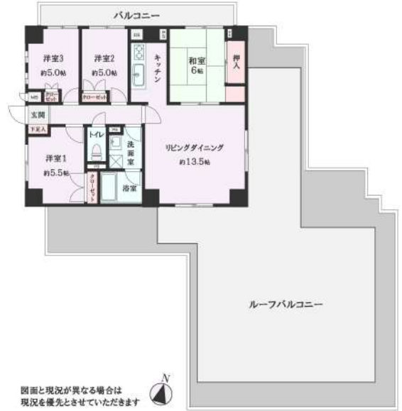
【間取り図】専有面積82.04㎡、ルーフバルコニー面積73.69㎡