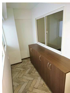
【玄関】広い土間風玄関は大型収納も可能