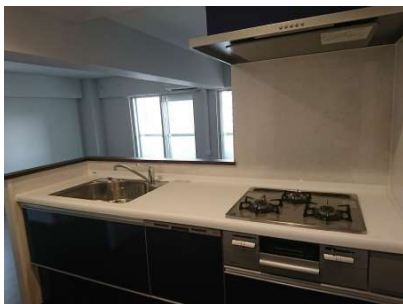
【キッチン】充実したシステムキッチン、食洗器付き