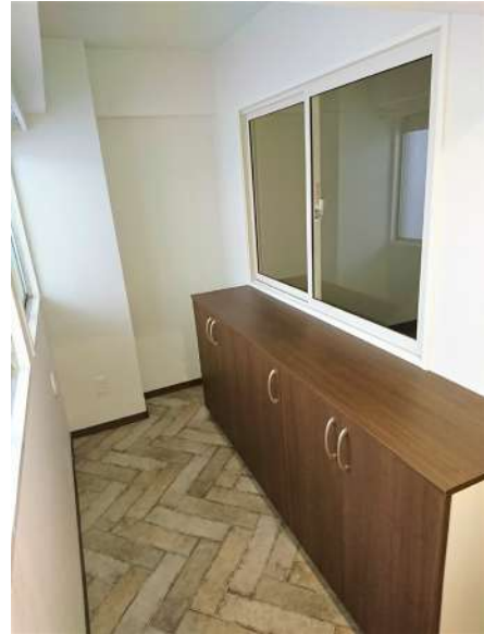
【玄関】広い土間風玄関は大型収納も可能