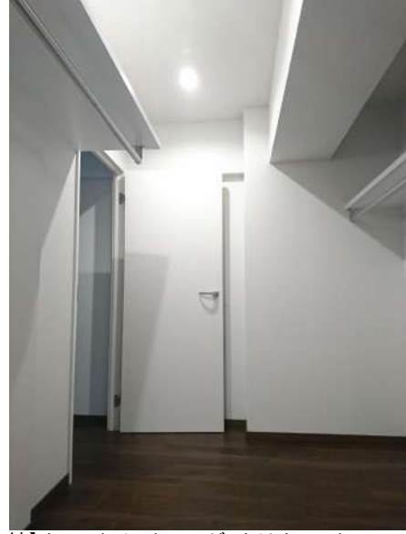
【収納】ウォークインクローゼットはウォークスルー型!