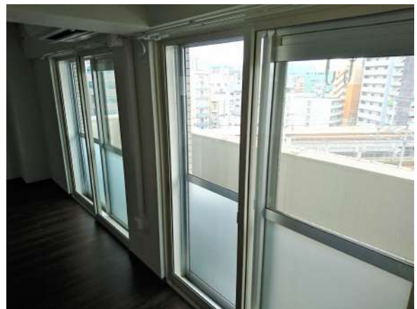
【居間・リビング】インプラス(後付け2重サッシ)設置