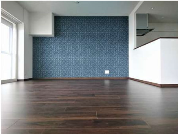
【リビングダイニング】広々リビング20.1畳!