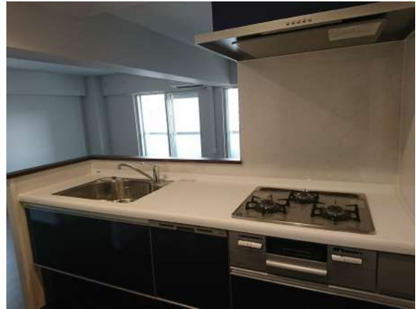
【キッチン】充実したシステムキッチン、食洗器付き