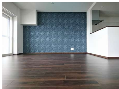
【リビングダイニング】広々リビング20.1畳!