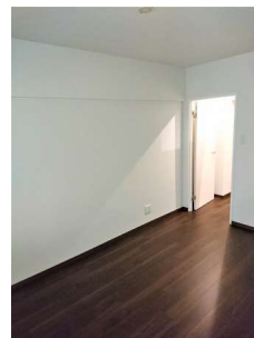
【洋室】寝室やゲストルームとしても