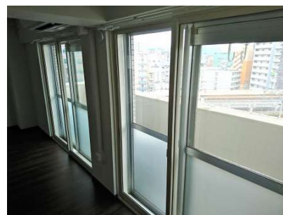
【居間・リビング】インプラス(後付け2重サッシ)設置