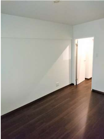
【洋室】寝室やゲストルームとしても