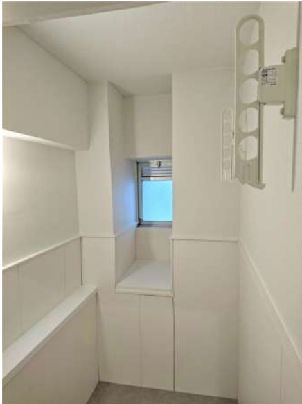
【ランドリースペース】作業部屋としても!