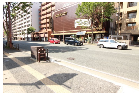
【前面道路含む現地写真】