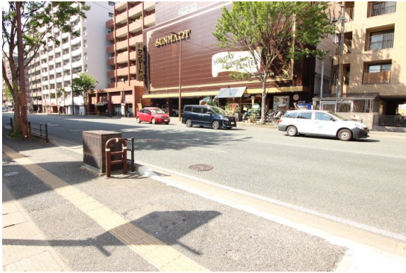
【前面道路含む現地写真】