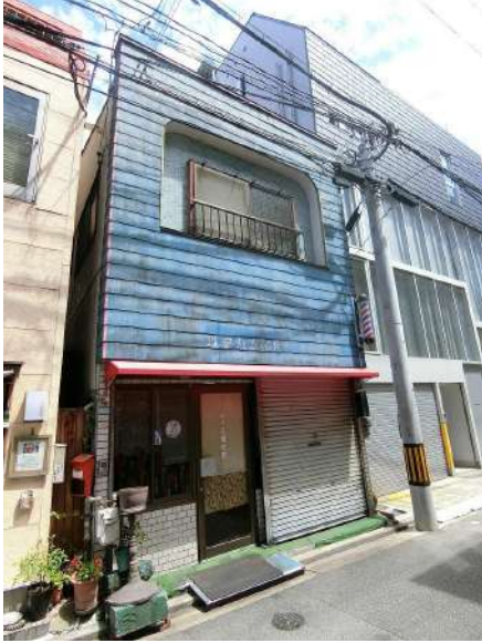
【前面道路含む現地写真】