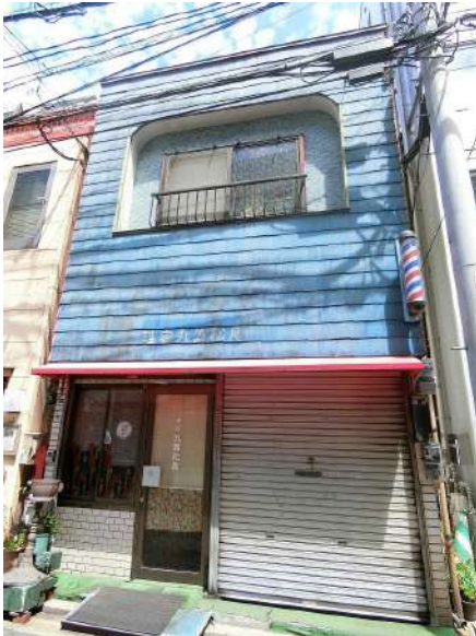
【前面道路含む現地写真】