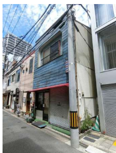
【前面道路含む現地写真】