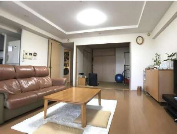
【リビングダイニング】家具・その他調度品は価格に含まません。