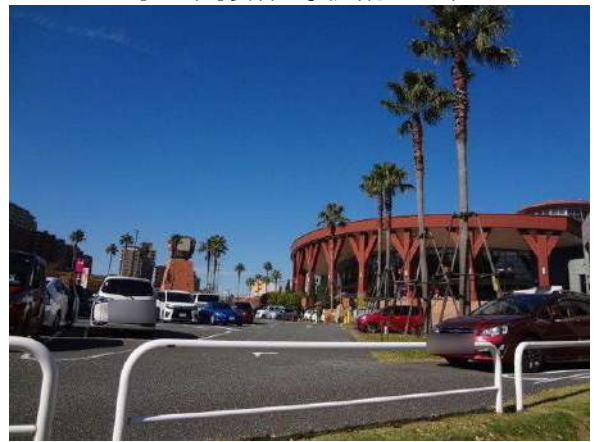
【その他】イオンマリナタウン店(約980m)