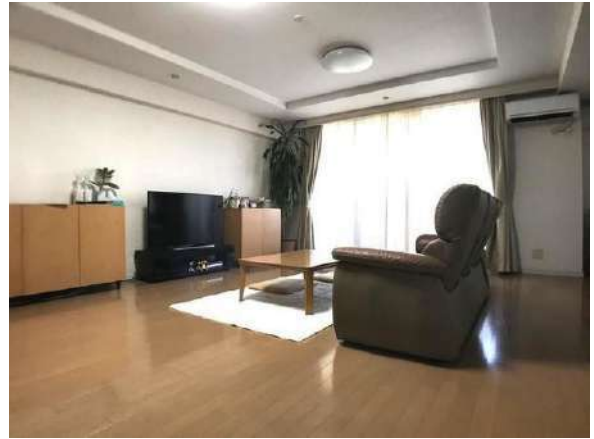
【リビングダイニング】家具・その他調度品は価格に含まません。