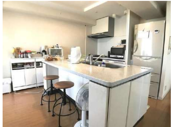
【キッチン】アイランドキッチン(家具・その他調度品は価格に含まません。)