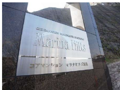
【外観写真】マンションエンブレム