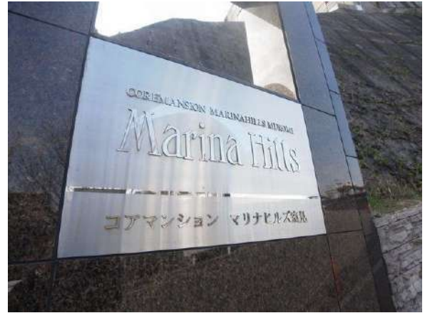
【外観写真】マンションエンブレム