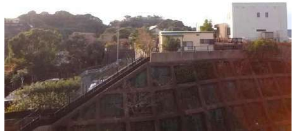
【眺望】バルコニーから愛宕神社を望みます