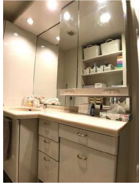
【洗面化粧台】家具・その他調度品は価格に含まません。