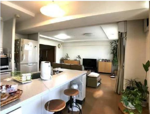
【リビングダイニング】家具・その他調度品は価格に含まません。