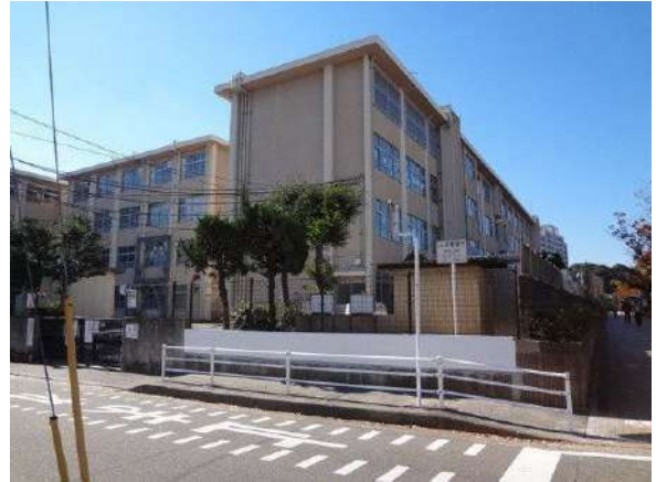
【その他】愛宕小学校(約470m)