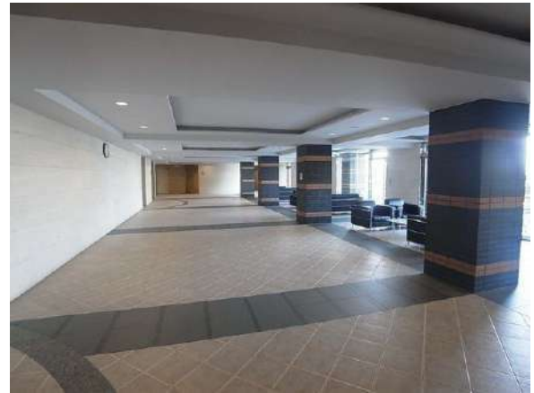
【エントランスホール】