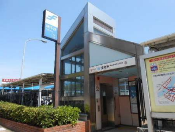
【その他】地下鉄空港線「室見」駅(約860m)