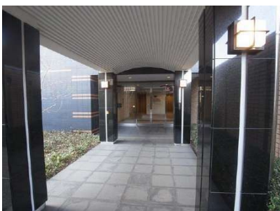
【エントランス(外)]アプローチ