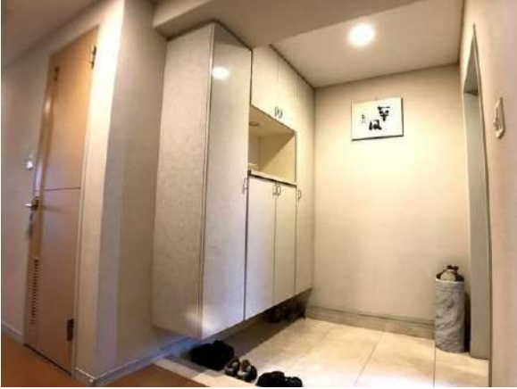
【玄関】家具・その他調度品は価格に含まません。