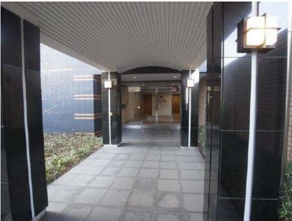
【エントランス(外)】アプローチ