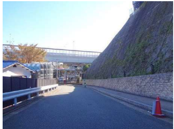
【その他】エントランス前アプローチ