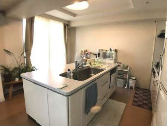
【キッチン】アイランドキッチン家具・その他調度品は価格に含まません。