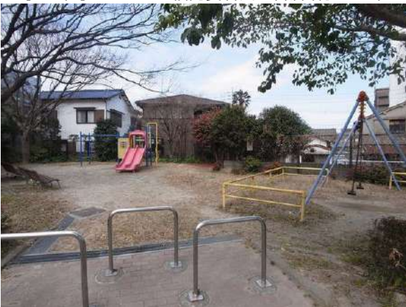
【その他】愛宕1号公園(約40m)