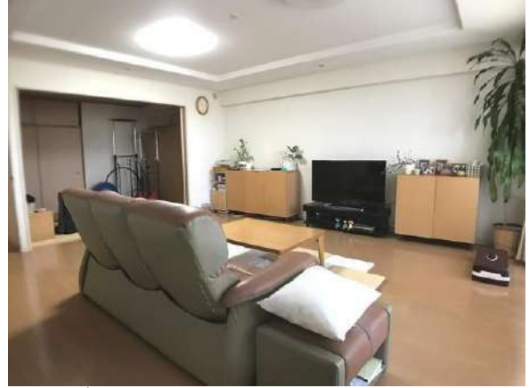
【リビングダイニング】家具・その他調度品は価格に含まません。