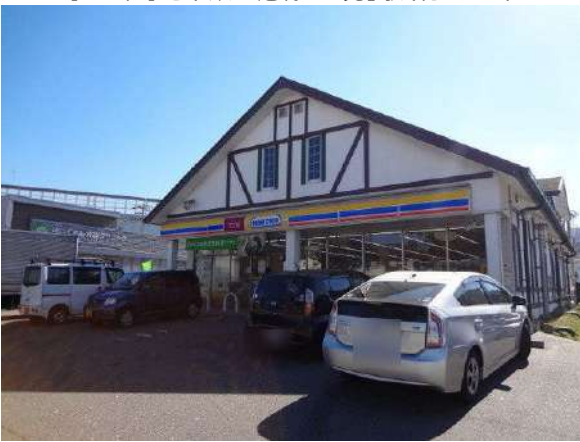
【その他】ミニストップ福岡愛宕四丁目店(約340m)