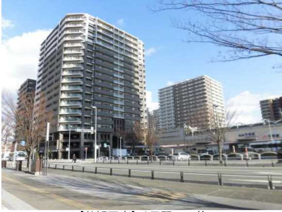
【外観写真】千早駅目の前