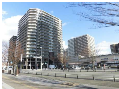
【外観写真】千早駅目の前