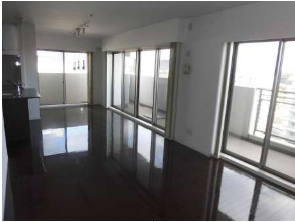
【リビングダイニング】