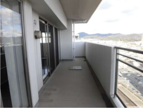
【バルコニー】リビング側バルコニー