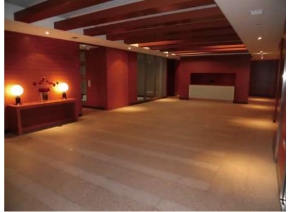
【エントランスホール】コンシェルジュサービス付き