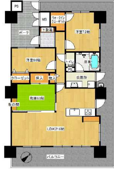
【間取り図】3LDK変更予定図