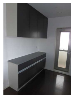
【キッチン】カップボード付き