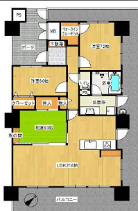
【間取り図】3LDK変更予定図