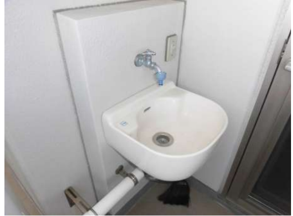
【その他設備】スロップシンク付き