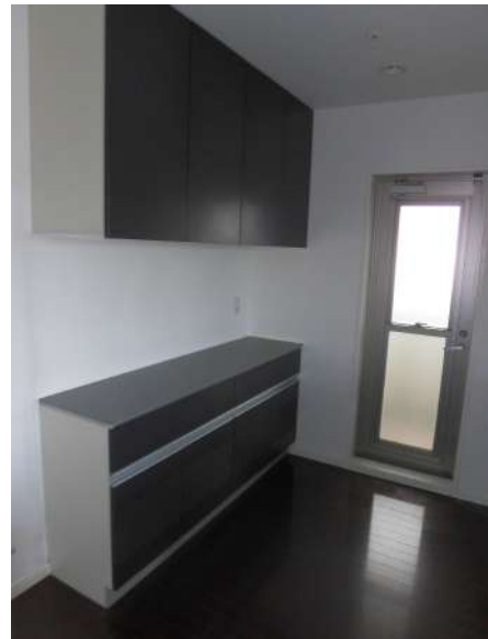
【キッチン】カッボード付き