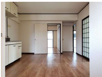
【ダイニングキッチン】