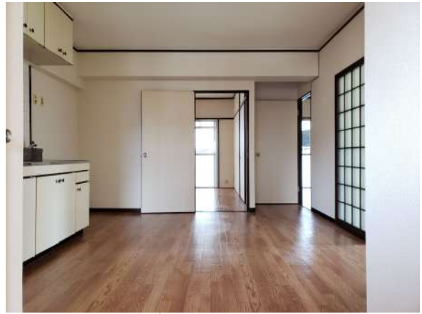
【ダイニングキッチン】