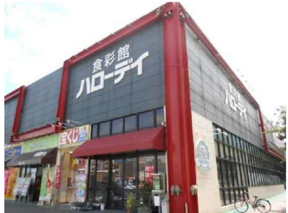
【その他】ハローデイ姪浜店(約440m)