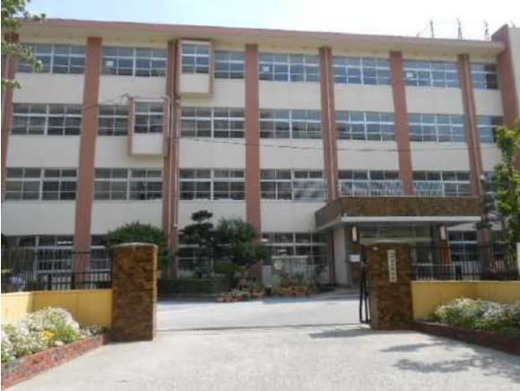
【その他】内浜中学校(約750m)