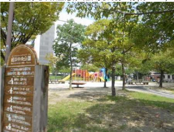
【その他】姪浜中央公園(約300m)