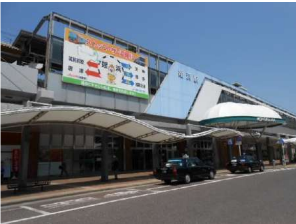
【その他】地下鉄空港線「姪浜」駅 徒歩8分(約680m)