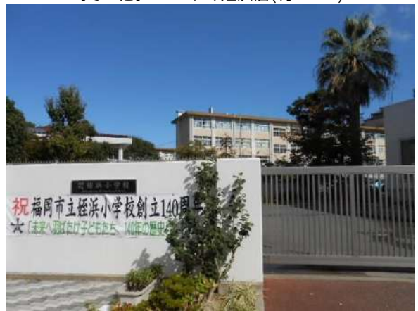
【その他】姪浜小学校(約1000m)