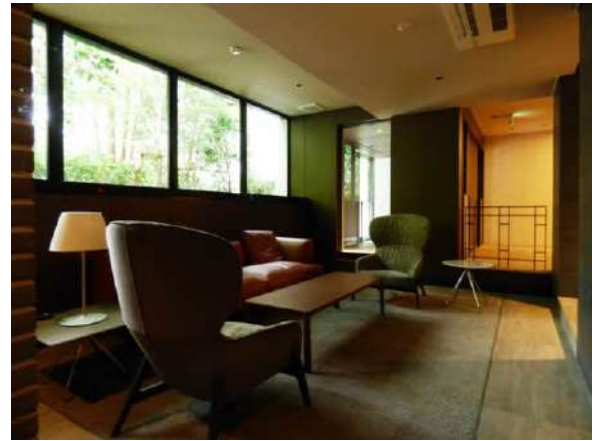
落ち着いた大人の雰囲気のリビー