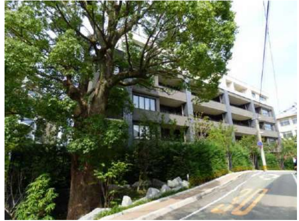
静かな環境に佇む立地