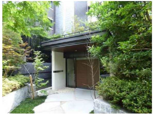
落ち着いた雰囲気のエントラス