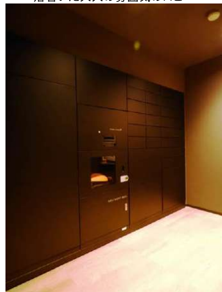
宅配・メールボックス