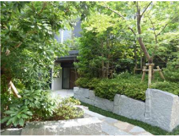
エントランスへ続くアプローチ