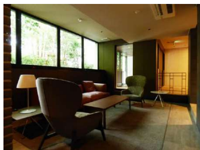
落ち着いた大人の雰囲気のコピー