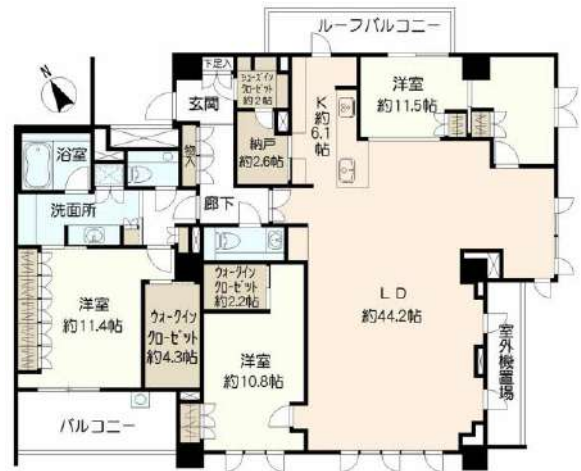
最上階LDK50.3帖、専有面積200㎡