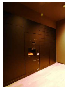
宅配・メールボックス