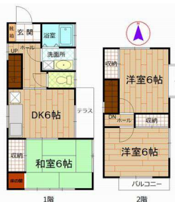
【間取り図】3DK 現況優先