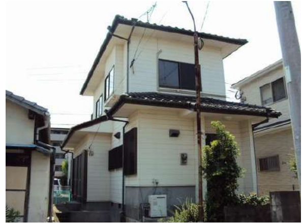
【外観写真】老司1丁目売家