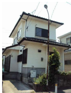
【外観写真】老司1丁目売家