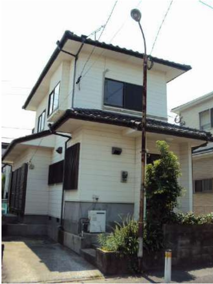
【外観写真】老司1丁目売家