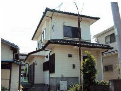
【外観写真】老司1丁目売家