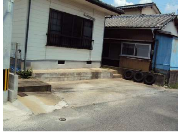
【外観写真】老司1丁目売家 裏側