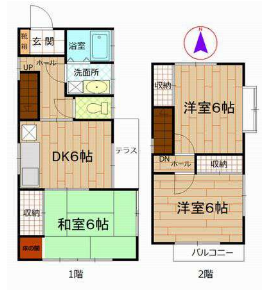
【間取り図】3DK 現況優先