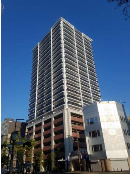
【外観写真】赤坂駅隣接の免震タワーマンション24階建の23階角部屋