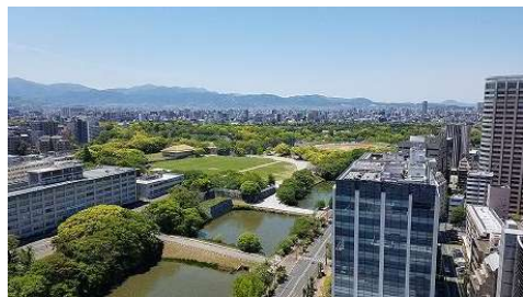
【その他】西側眺望 大濠公園が見渡せます。