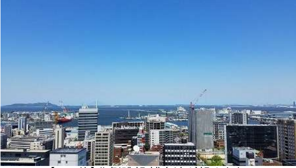
【その他】北側眺望 博多湾が望めます。