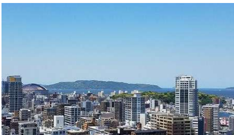
【その他】北西側 西公園、能古島が一望できます。