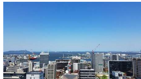
【その他】北側眺望 博多湾が望めます。