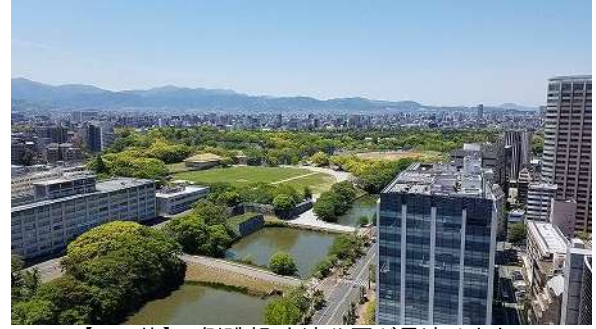
【その他】西側眺望 大濠公園が見渡せます。