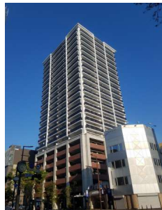
【外観写真】赤坂駅隣接の免震タワーマンション24階建の23階角部屋