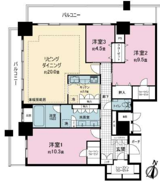
【間取り図】20畳の広々リビングは床暖房付 浴室は窓・TV付