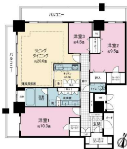
【間取り図】20畳の広々リビングは床暖房付 浴室は窓・TV付