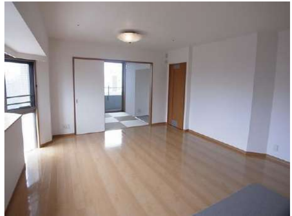
【リビングダイニング】約15.3帖