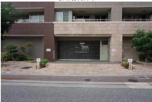
【駐車場】シャッターゲート式駐車場