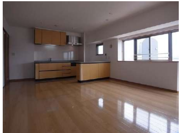
【リビングダイニング】約15.3帖