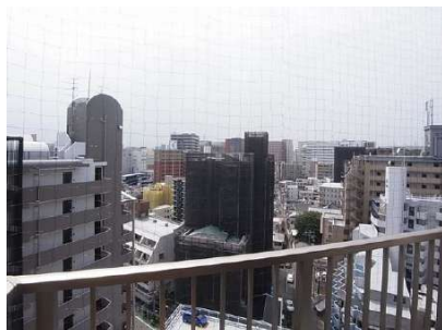
【眺望】洋室からの眺望