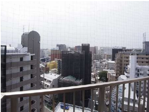
【眺望】洋室からの眺望