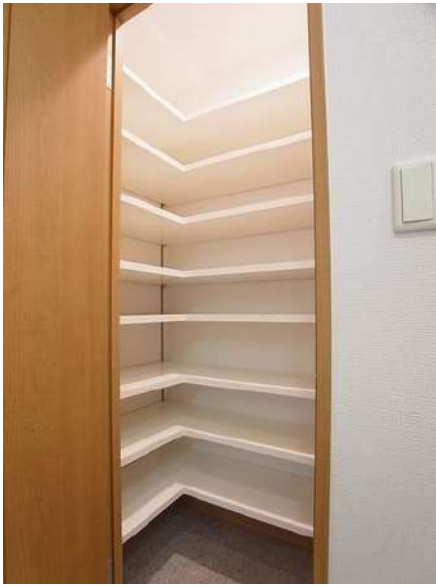
【収納】シューズクローク