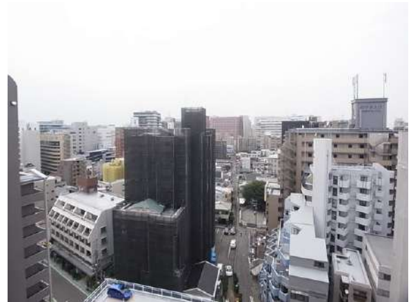
【眺望】リビングからの眺望