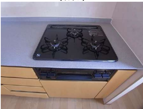
【キッチン】3口コンロ