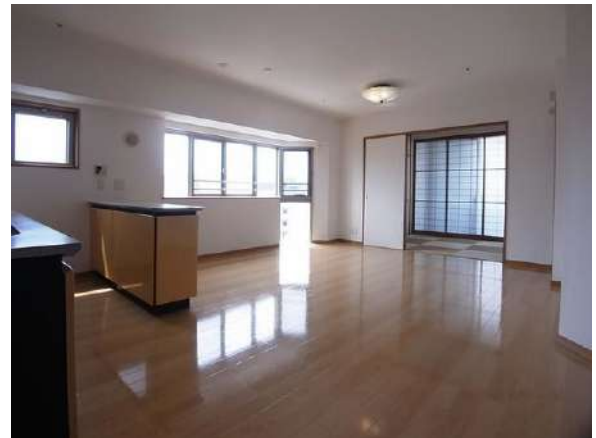
【リビングダイニング】約15.3帖