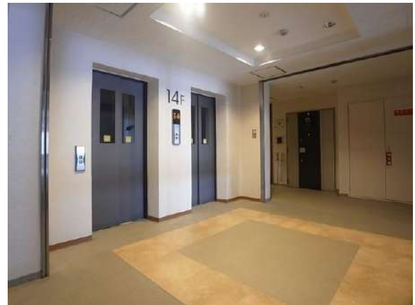
【その他共用部】14階フロア