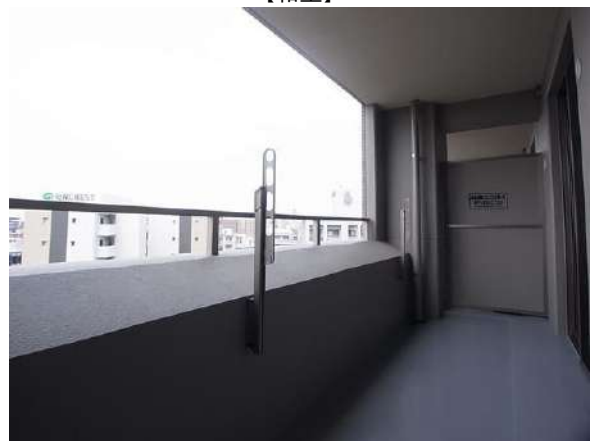
【バルコニー】北東側バルコニー