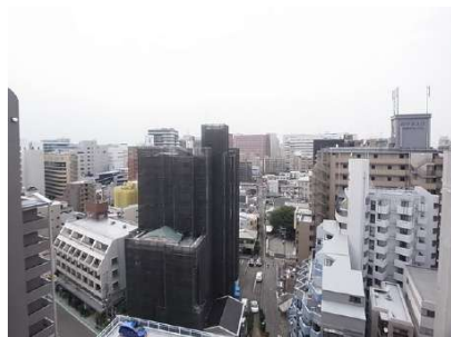
【眺望】リビングからの眺望