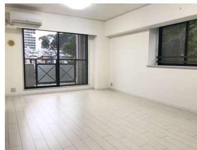
【リビングダイニング】フローリング張替済