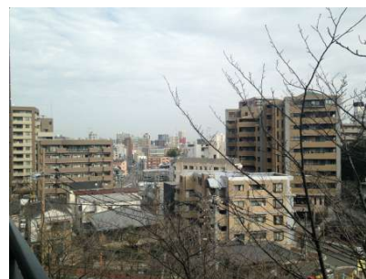
【その他】見晴らしもいいです