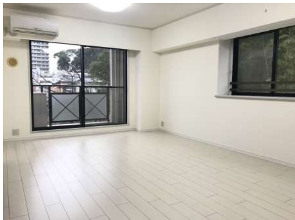
【リビングダイニング】フローリング張替済