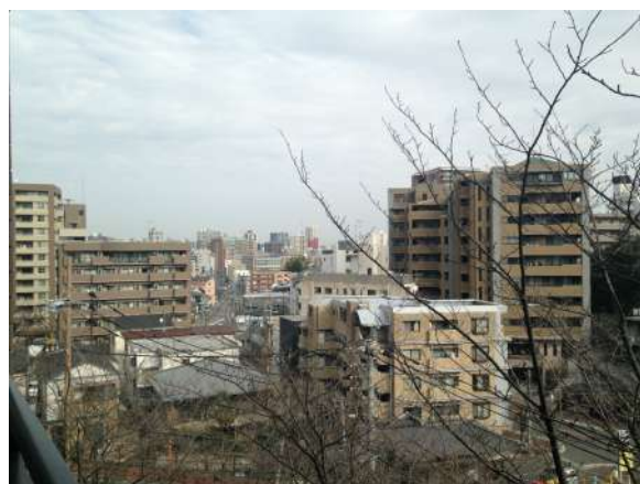
【その他】見晴らしもいいです