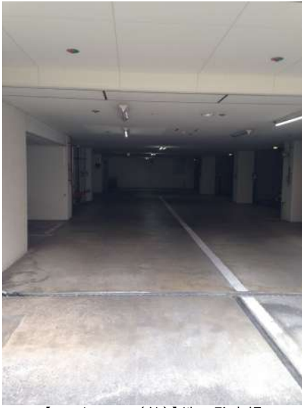
【エントランス(外)】地下駐車場