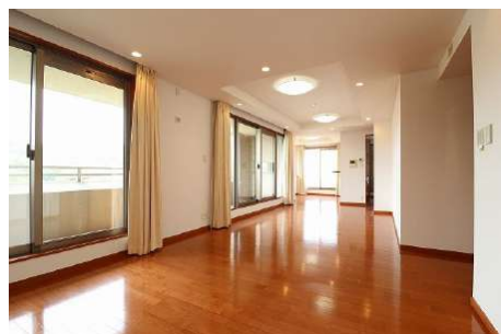
【リビングダイニング】