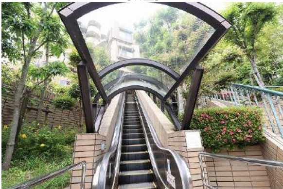
【その他設備】エレベーターあり