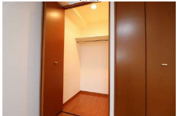
【ウォークインクローゼット】