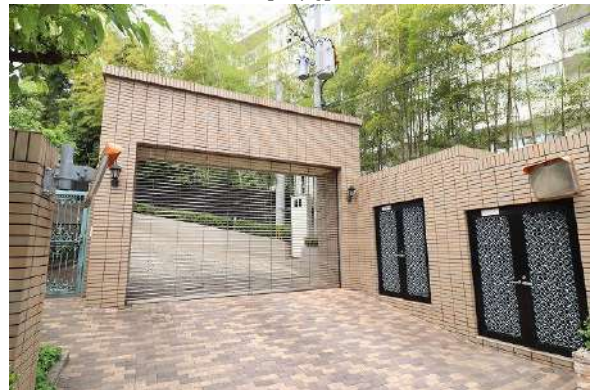
【駐車場】電動シャッターゲートあり