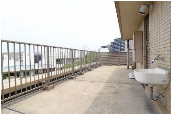
【バルコニー】ルーフバルコニーあり