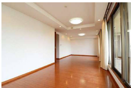
【リビングダイニング】