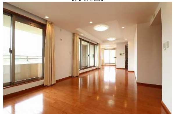
【リビングダイニング】