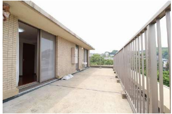
【バルコニー】ルーフバルコニーあり