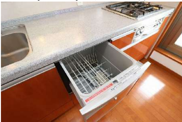
【キッチン】食器洗浄機あり