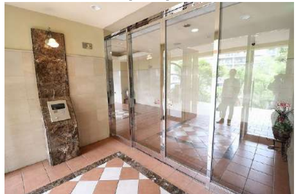
【エントランスホール】