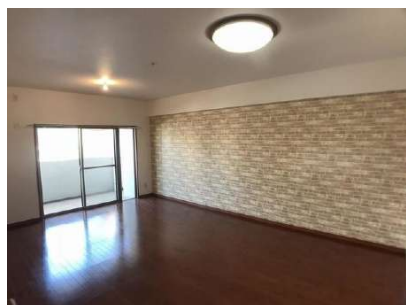
【リビングダイニング】LDK 約13.4帖