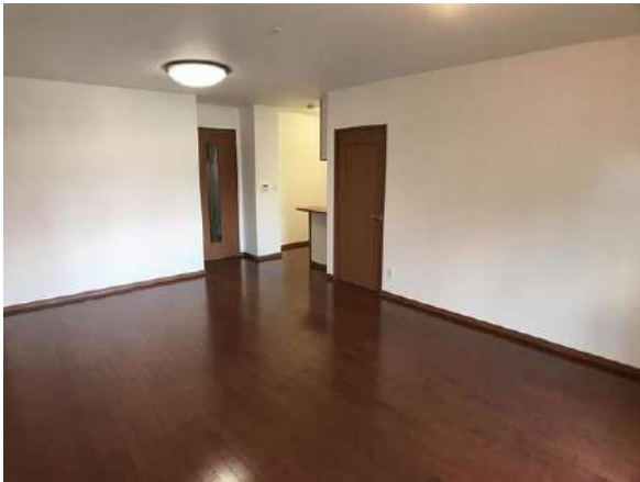
【リビングダイニング】LDK 約13.4帖