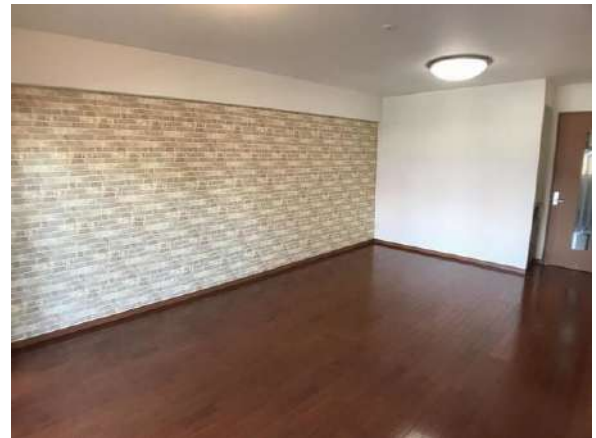
【リビングダイニング】LDK 約13.4帖