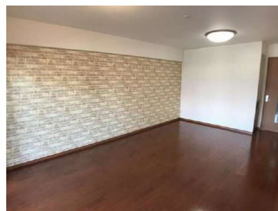
【リビングダイニング】LDK 約13.4帖