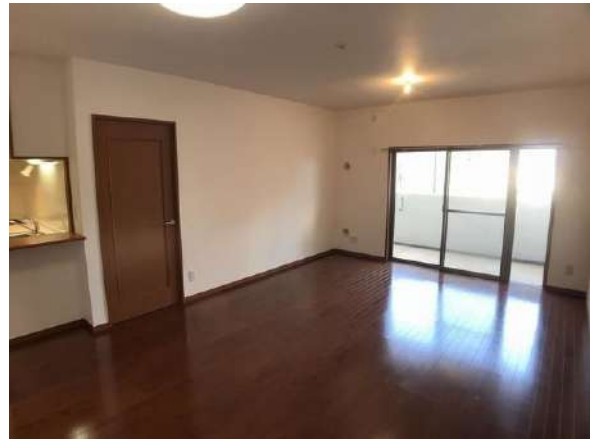
【リビングダイニング】LDK 約13.4帖