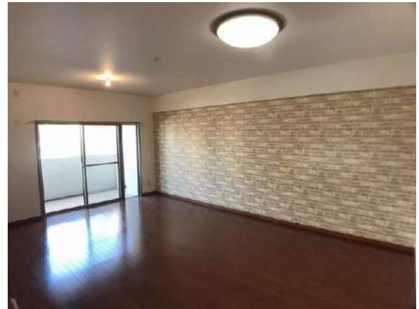
【リビングダイニング】LDK 約13.4帖