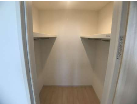
【ウォークインクローゼット】