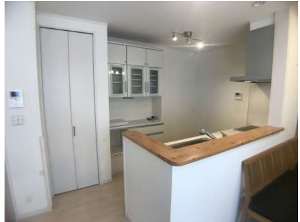
【キッチン】カップボード・パントリー