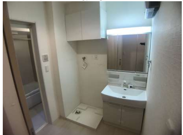
【脱衣場】3面鏡付洗面台・吊戸収納有