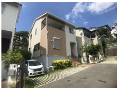
【外観写真】 駐車2台可