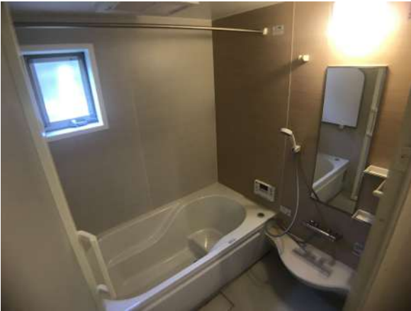
【浴室】浴室乾燥機付