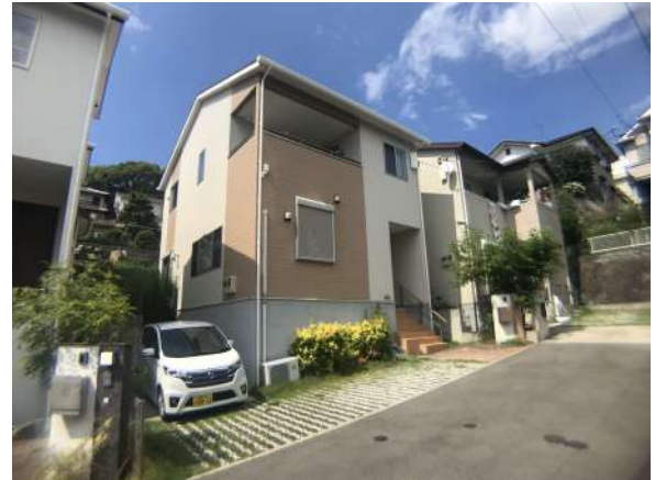
【外観写真】駐車2台可