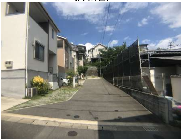
【前面道路含む現地写真】