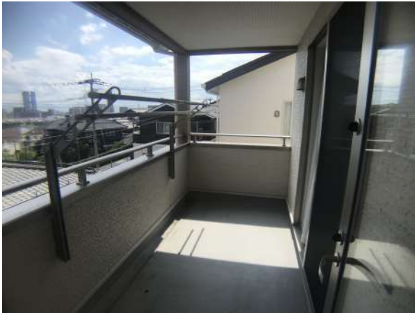
【バルコニー】南面日当たり良好!