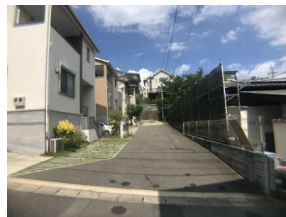
【前面道路含む現地写真】