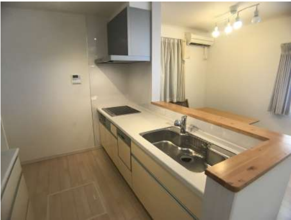
【キッチン】食洗器・浄水器付