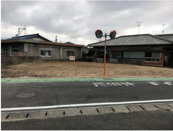
【前面道路含む現地写真】