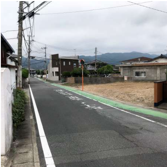
【前面道路含む現地写真】