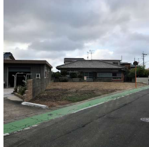
【前面道路含む現地写真】