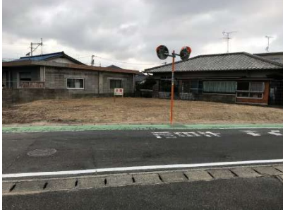
【前面道路含む現地写真】