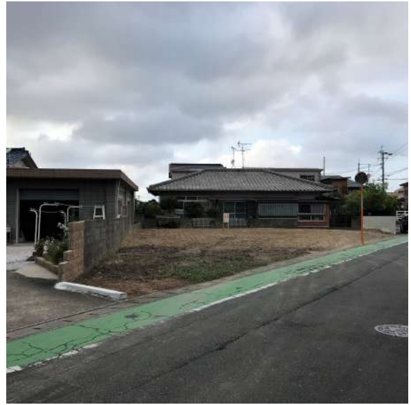
【前面道路含む現地写真】