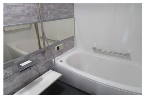
ユニットバス新品!『ほっカラリ床』であったか。翌朝カラリ。