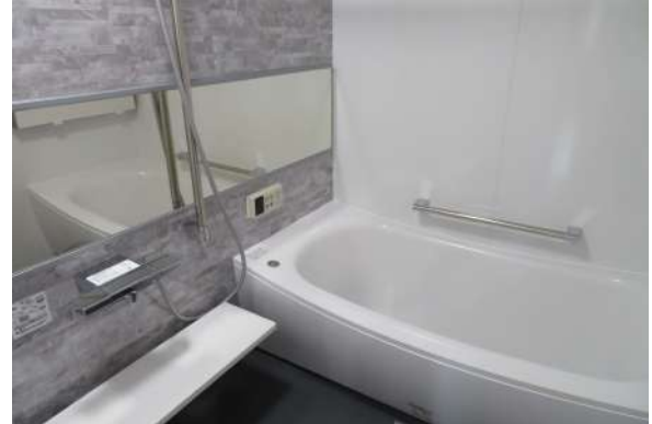
ユニットバス新品!『ほっカラリ床』であったか。翌朝カラリ。