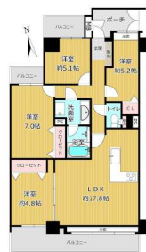
令和元年7月中旬内装リノベーション済み!!