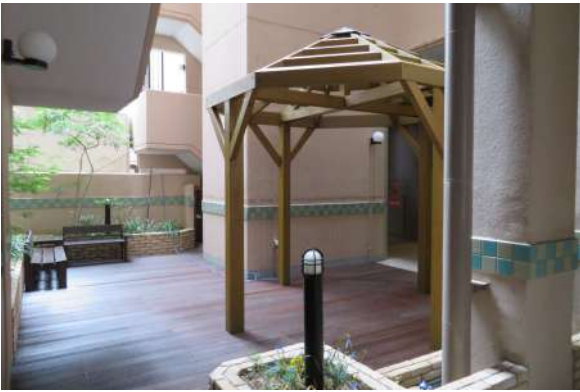
エントランスにある憩いのスペース。