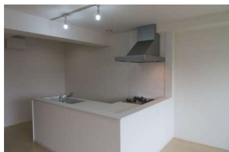
リビングを見渡しながら家事ができる様、対面式DK。