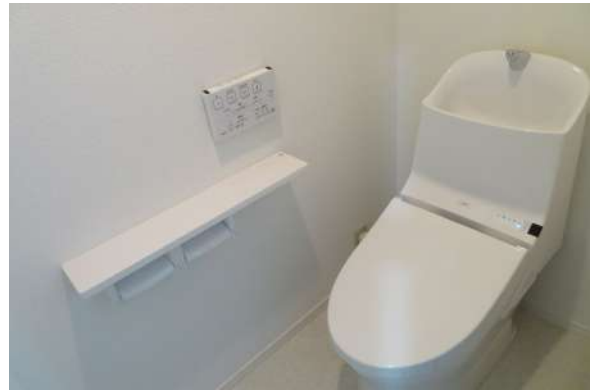
ウォシュレット新品!