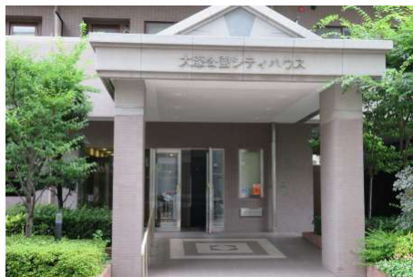
大濠公園まで徒歩約3分の好立地!