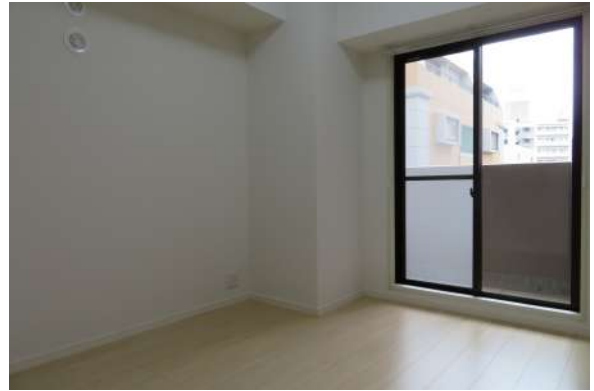
約5帖洋室。バルコニー付き