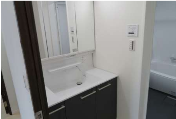
大きな新品のシャンプードレッサー。