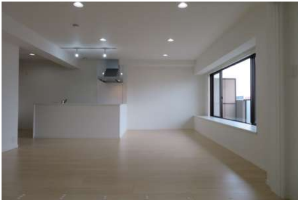
LDK横の洋室の間仕切りをあげて、約22.6帖のスペースに!