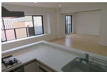
L型キッチンがオシャレなアクセントになっているDK。