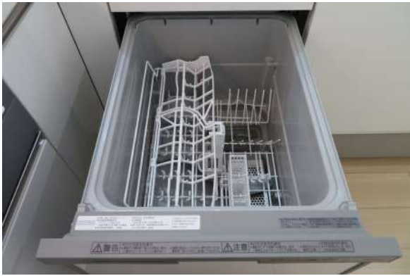
新品のシステムキッチンには食洗機がついています。