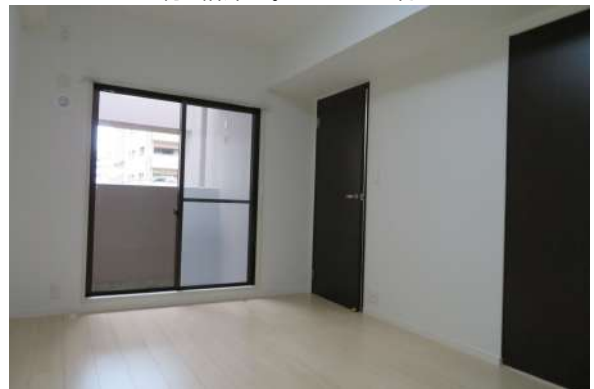
約7帖洋室。バルコニー付き