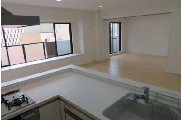
L型キッチンがオシャレなアクセントになっているLDK。