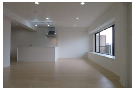
LDK横の洋室の間仕切りをあけて、約22.6帖のスペースに!