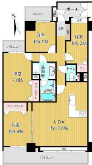
令和元年7月中旬内装リノベーション済み!!