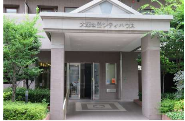
大濠公園まで徒歩約3分の好立地!