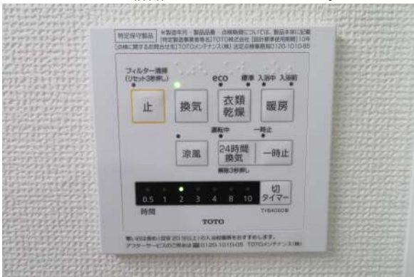
浴室暖房&浴室乾燥機付きで快適です。