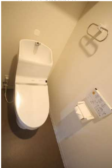
多機能ウォシュレット付