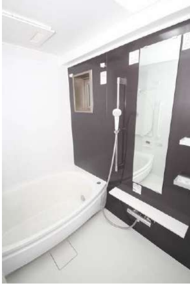
魔法びん浴槽を採用♪浴室乾燥暖房機有