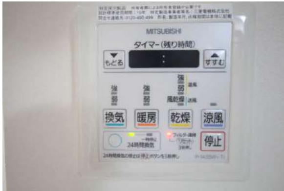
浴室乾燥暖房機操作パネル