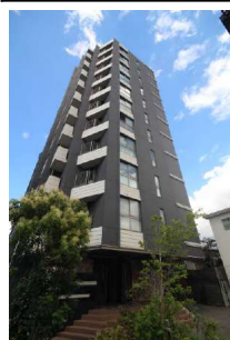
平成27年3月築。11階建10階部分角住戸