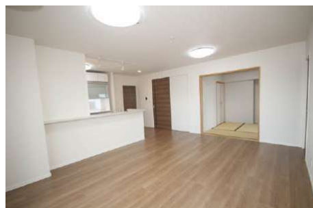
室内大変綺麗にお使いです