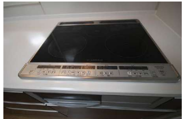
IHクッキングヒーター