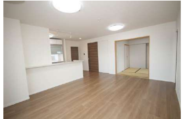
室内大変綺麗にお使いです