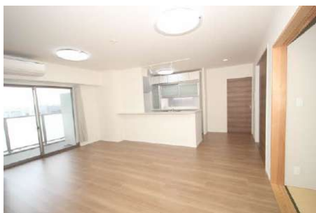
ペアガラス・T-2等級防音サッシ採用