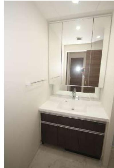
三面鏡の洗面化粧台