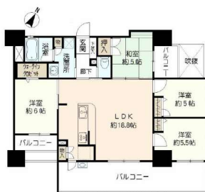
南側の窓ガラス3ヶ所にUV99.5%カットフィルム LDK(約18.8帖) 施工!