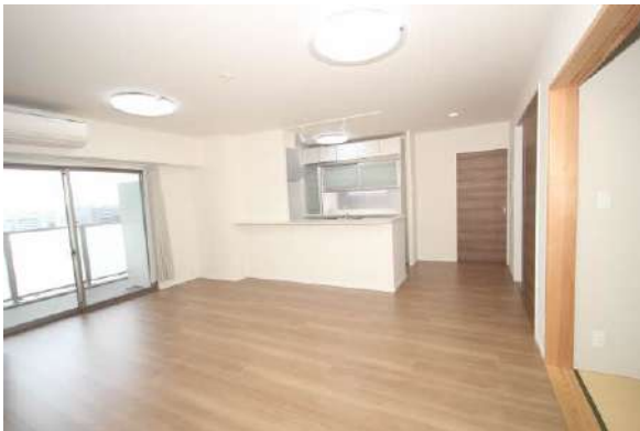
ペアガラス・T-2等級防音サッシ採用