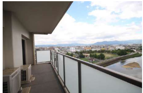
奥行最大1.9mのバルコニー!スロップシンク有。