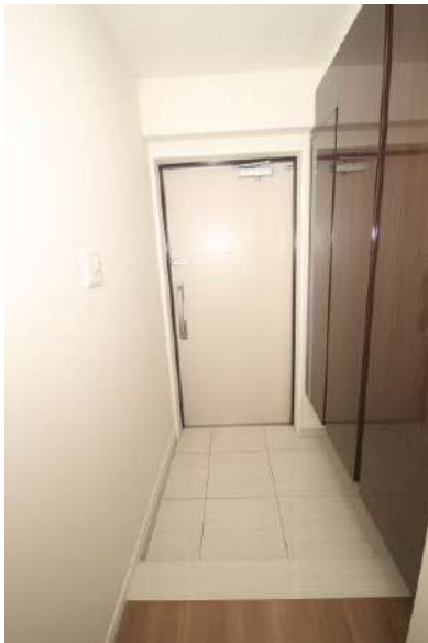
大容量収納出来る下足入有