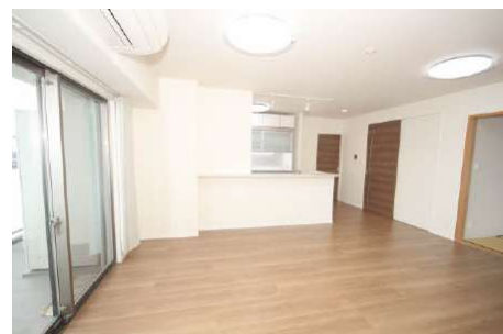
窓から光が差し込む明るいリビングです