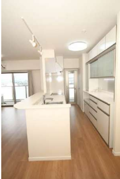
勝手口・物入・カップボード・IHクッキングヒーター・食洗機有