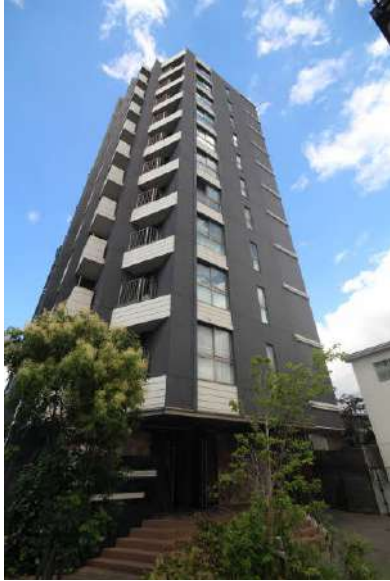
平成27年3月築。11階建10階部分角住戸