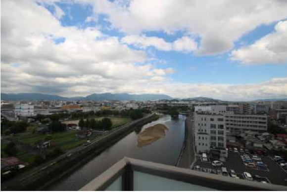
眺望良好!リバービューです。