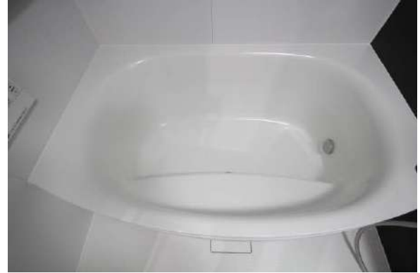
浴槽の周囲を断熱材で覆った「魔法びん浴槽」。保温効果◎!