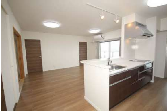
お料理をしながらリビングの様子が分かります♪