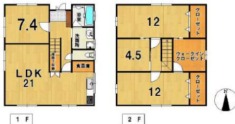
【間取り図】JR・西鉄ダブルアクセス可能