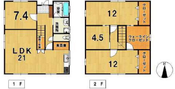
【間取り図】JR・西鉄ダブルアクセス可能