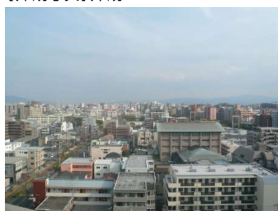
【眺望】バルコニーからの眺望