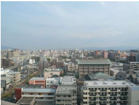
【眺望】バルコニーからの眺望