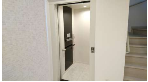
・ホームエレベーター