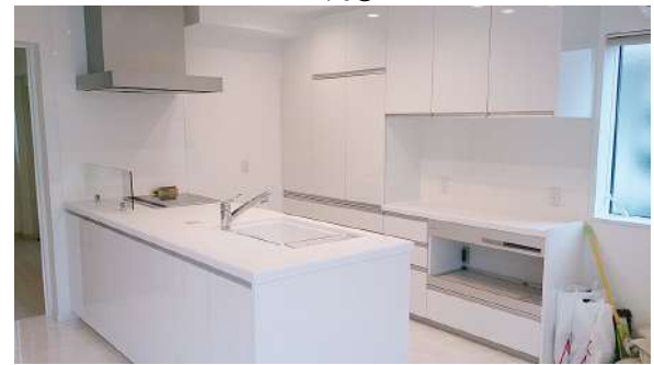
・システムキッチン