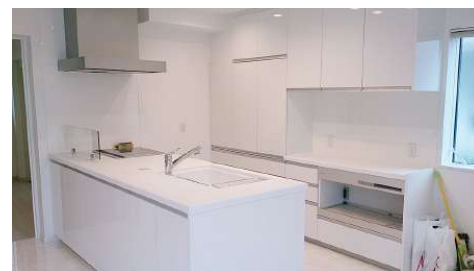
・システムキッチン