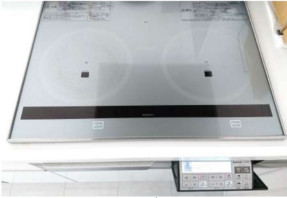
・IHクッキングヒーター