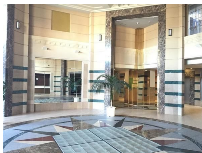
【エントランスホール】