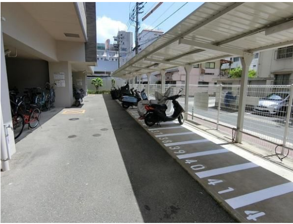
【その他共用部】バイク駐車場