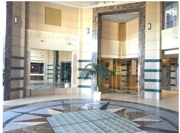
【エントランスホール】