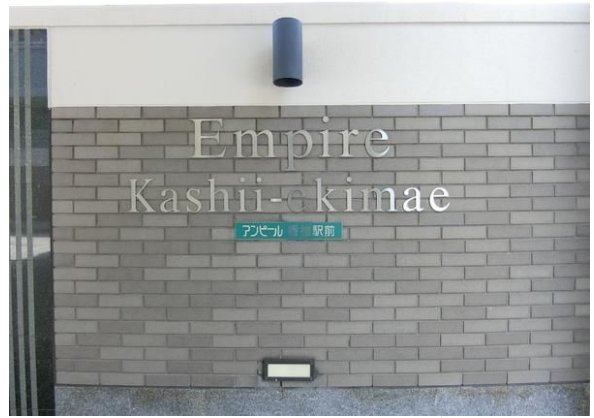
【その他共用部】マンションエンブレム