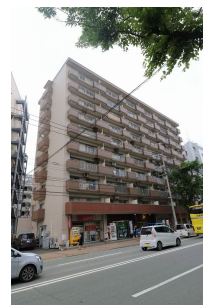
【外観写真】いつでもご案内可能です!お問い合わせお待ちしております!