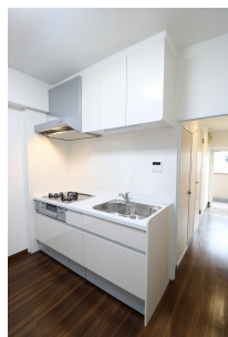
【キッチン】システムキッチン新品交換しています!3口ガスコンロです