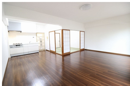
【リビングダイニング】約16.5帖の広々LDK!! 新品LED照明付きです♪