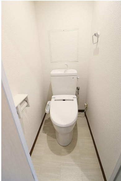
【トイレ】温水洗浄便座新品交換済みです!