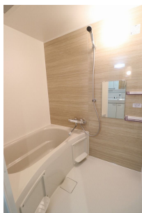
【浴室】追炊き機能付き♪ ゆったり浸かれるタイプです!