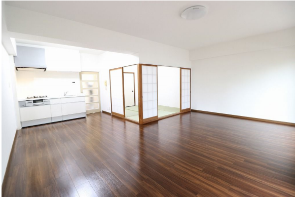
【リビングダイニング】約16.5帖の広々LDK!! 新品LED照明付きです♪