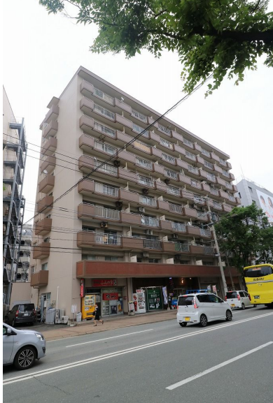
【外観写真】いつでもご案内可能です!お問い合わせお待ちしております!