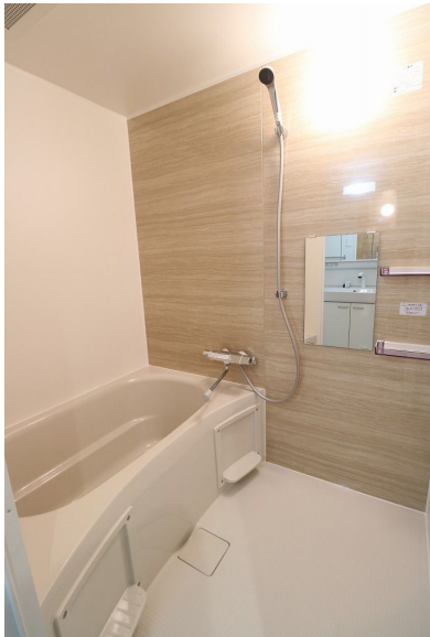
【浴室】追炊き機能付き♪♪ ゆったり浸かれるタイプです!