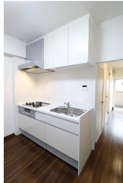
【キッチン】システムキッチン新品交換しています!3口ガスコンロです