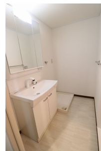
【脱衣場】シャワー付き洗面台に新品交換しています!