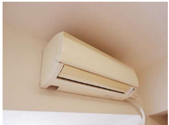
【冷暖房・空調設備】