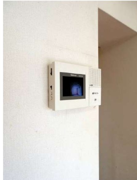
【TVモニタ付きインターフォン】