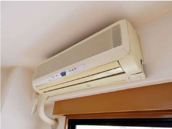
【冷暖房・空調設備】