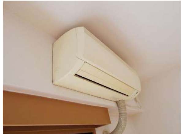
【冷暖房・空調設備】