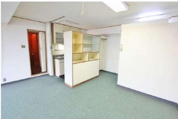
【ダイニングキッチン】