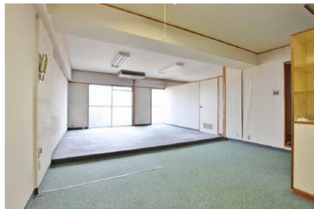
【リビングダイニング】