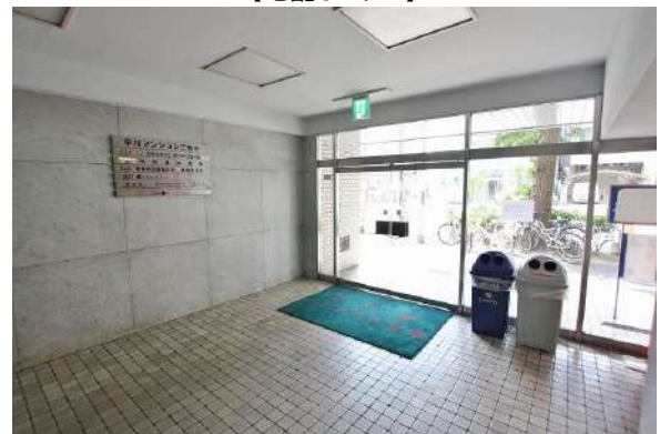
【エントランスホール】