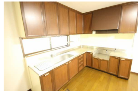
収納力のあるキッチン