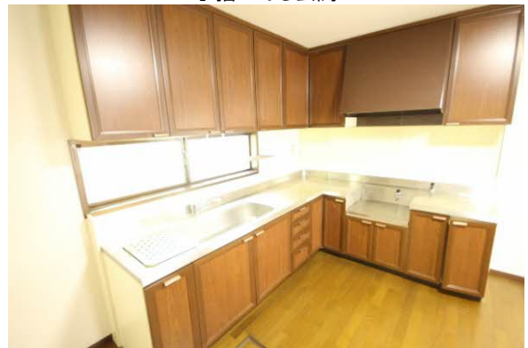
収納力のあるキッチン