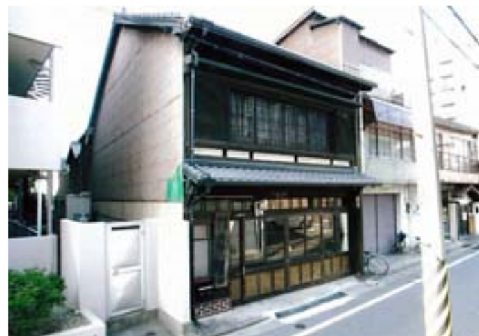
高橋家住宅店舗兼主屋

解説文： 博多町人町に位置し、堅町筋に北面する。間口五・六メートル奥行一メートルの木造二階建。切妻造棧瓦葺で正面に庇を付ける。二階は格子戸、一階はガラス戸を全面にたてる。通り土間で正面にミセを設け、二階に座敷三室を配する。標準的な博多の近代町家。