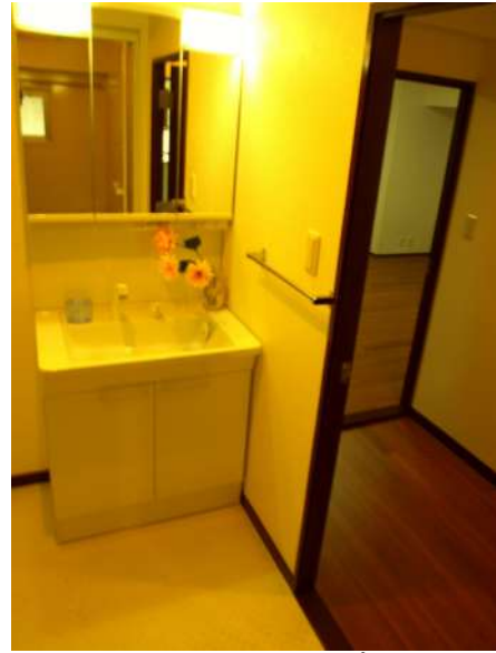
【脱衣場】新品の三面鏡シャンプードレッサー