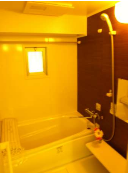
【浴室】新品取替。浴室乾燥機付き!