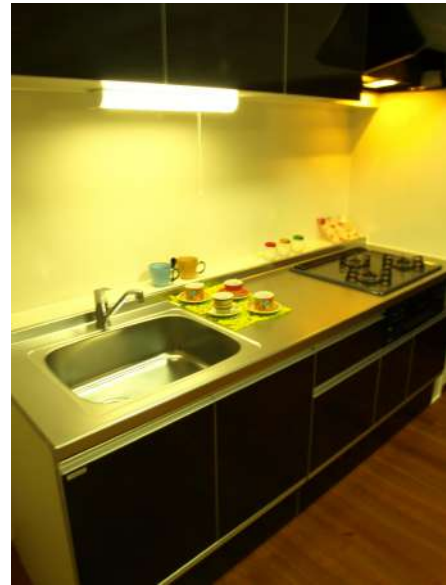
【キッチン】新品のシステムキッチン