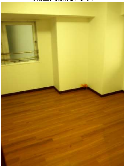
【洋室】玄関横の洋室です。