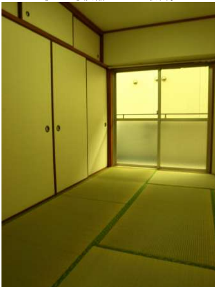
【和室】収納たっぷり!