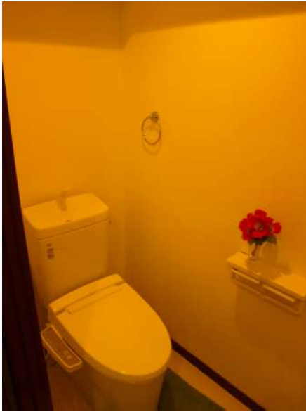
【トイレ】便器まるごと取替。