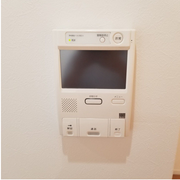
【TVモニタ付きインターフォン】テレビ付モニター