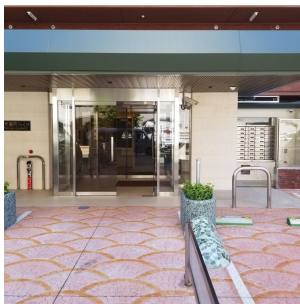
【エントランス(外)】エントランス