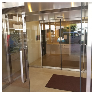
【エントランスホール】オートロック付