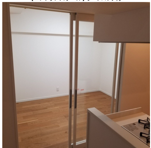
【洋室】スケルトンルーム付