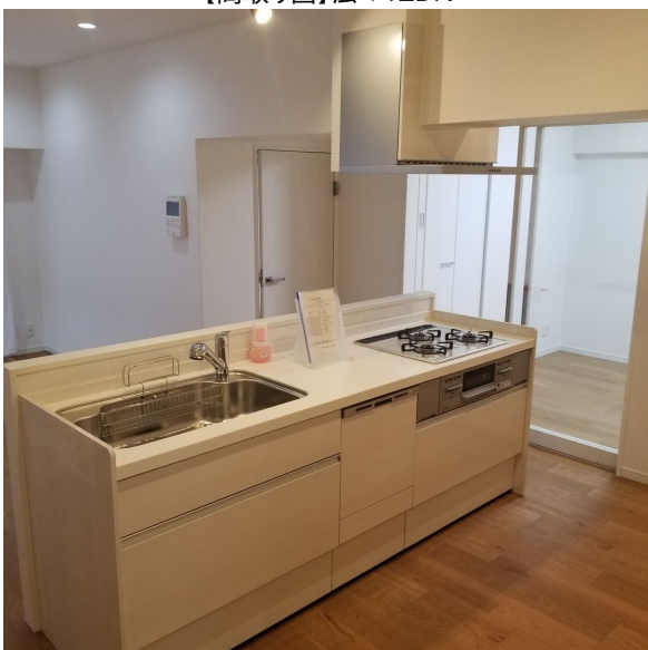
【リビングダイニング】出入りしやすいダイニングキッチン