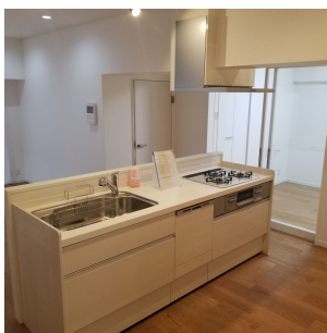
【リビングダイニング】出入りしやすいダイニングキッチン【洋室】スケルトンルーム付