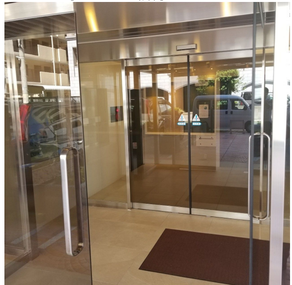
【エントランスホール】オートロック付