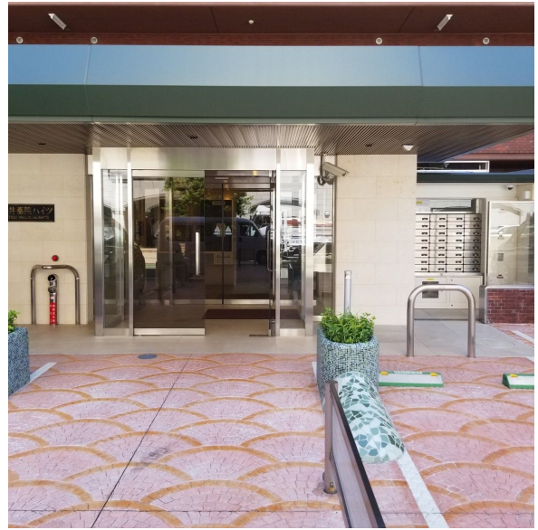
【エントランス(外)】エントランス