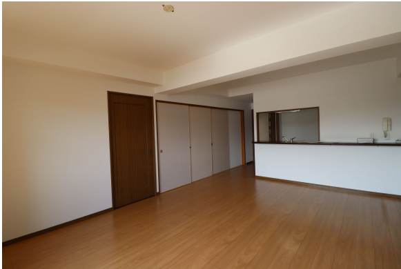
【リビングダイニング】