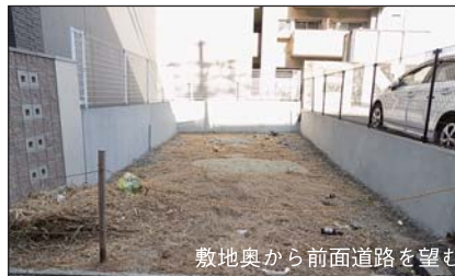
敷地奥から前面道路を望む