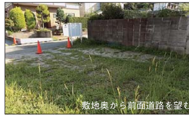
敷地奥から前面道路を望む