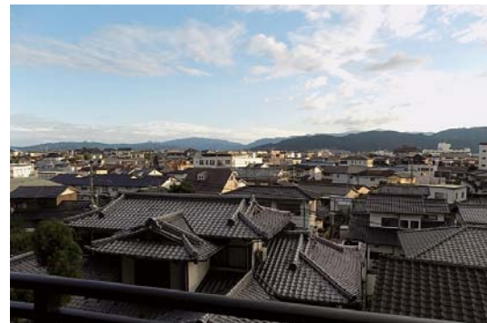
眺望良好のバルコニーは南向き