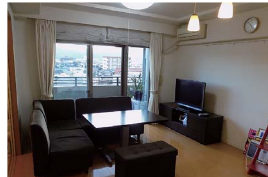
とってもキレイにお使いの住まいです