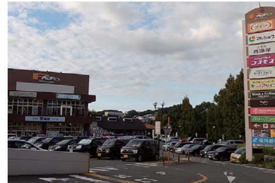
マンションの目の前は複合商業施設・パセオ野間大池