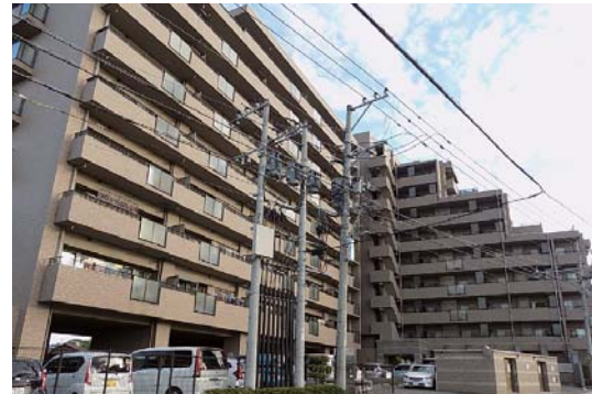
105戸の大型マンションです