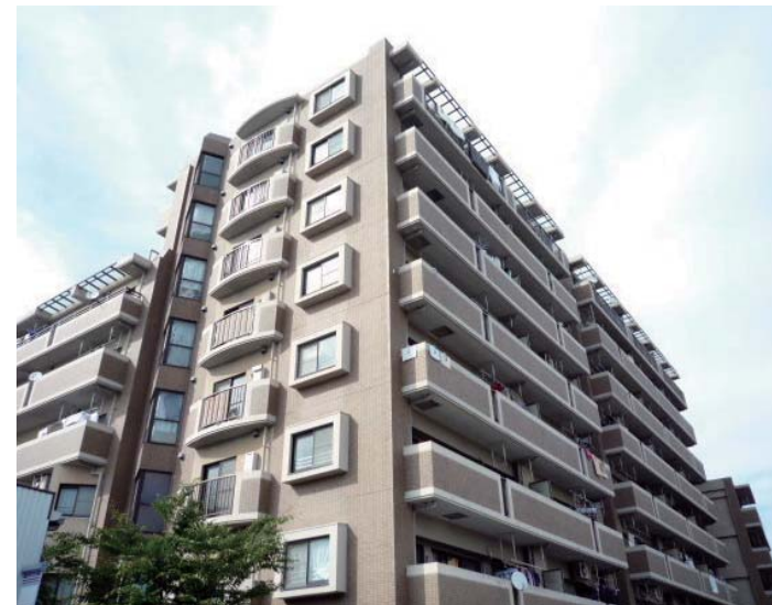
昨年12月に大規模修繕完了!! ピカピカになりました