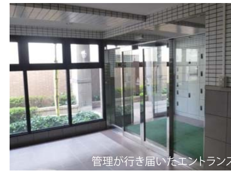
管理が行き届いたエントランス