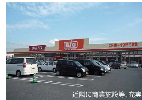
近隣に商業施設等、充実!